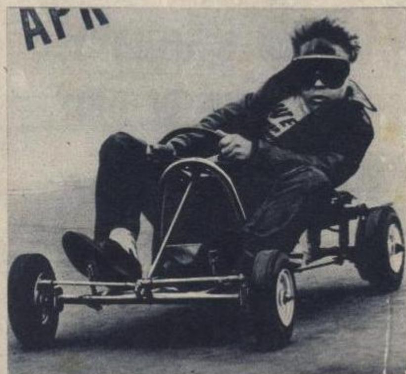
Jeugd en spanning. — Snelheid met rudimentaire middelen. — Dit toont ons deze foto van een jonge «karter». In ons land is 18 jaar de minimum leeftijd om aan «kart» wedstrijden te mogen deelnemen.

Tot de meest actieve clubs in het Vlaamse landsgedeelte behoren de Antwerp Kart Racing Club, de Antwerpse Vicking Club en de Mechelse Kart Club. Een paar gekende «kart»-merken zijn: «Bel kart», Panizet, «Blow kart» en «Socovel».